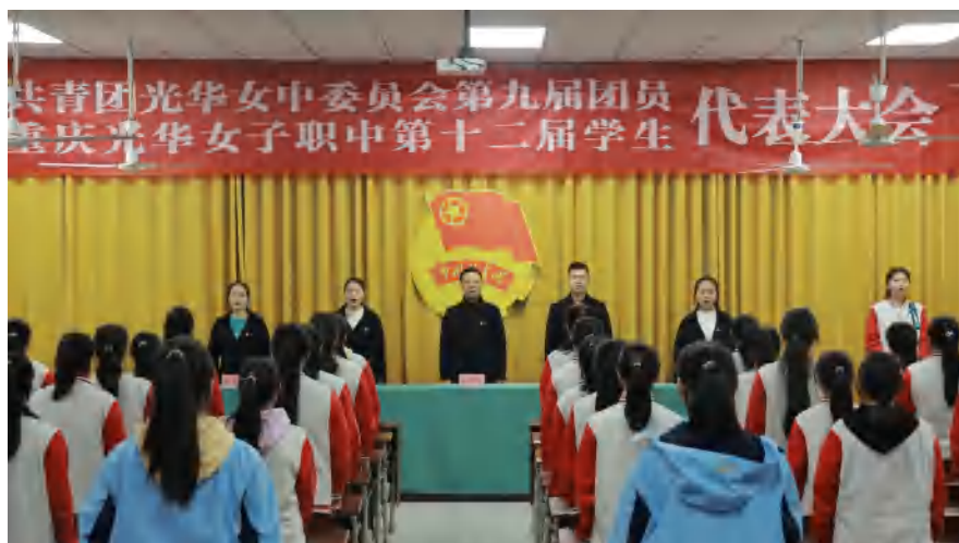
图 21 学校治理 学生自治组织学生代表大会

（5）财务管理。学校财务管理机构健全，设置了会计、出纳相关财务岗位，财务人员每年定期参加学习培训，以提升财务工作能力；制定了《学校财务管理制度》、《专项资金核算管理制度》等财务制度；各项收费均按相关部门规定执行，财务预决算实行民主管理，财务公开，做到账目日记、月审、年公布，做到计划开支、合理支出，全面加强学校财务管理。