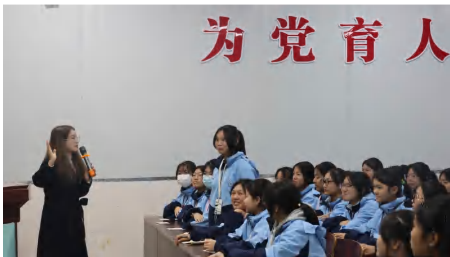
图 3 立德树人 思政课程教学活动