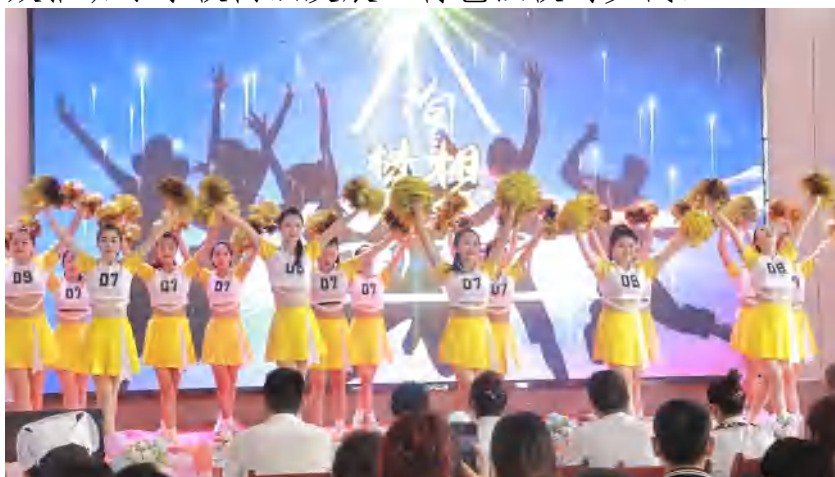
图 19 政策落实 职业教育月活动展演

全校师生群策群力，精心打磨，开幕式结束后，为大家带来了形式丰富、精彩纷呈的文艺节目和技能，《逐梦轨来》《礼仪操走秀》《我选我自己》，《天使如花，美丽绽放》《呼唤王小二》《货币清查》《中华饮食文化》《礼仪操走秀》《我选我自己》等极富专业色彩的节目，在此基础上，倾心演绎了富有文化底蕴的《绽放》《呼唤王小二》《中华饮食文化》等，全方位展示了学校师生的专业及文化素养，有效推动了学校内涵发展、特色强校的步伐。