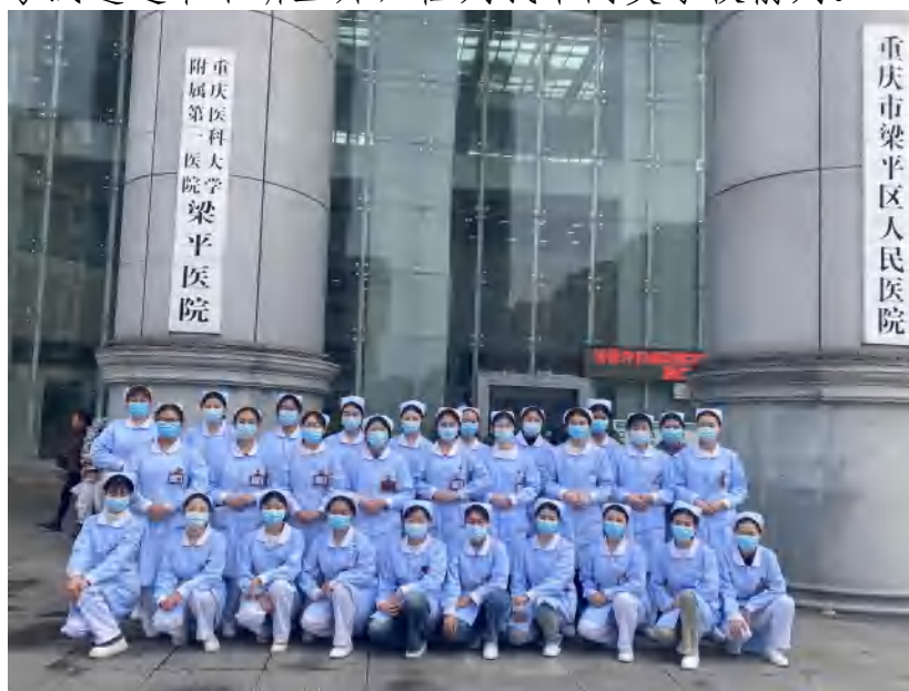
图 16 人才共育 专业技能实践操作培训

通过多年经验的不断积累，学校护士执业资格证考试培训规模不断扩大，考试通过率不断上升，位列我市同类学校前列。