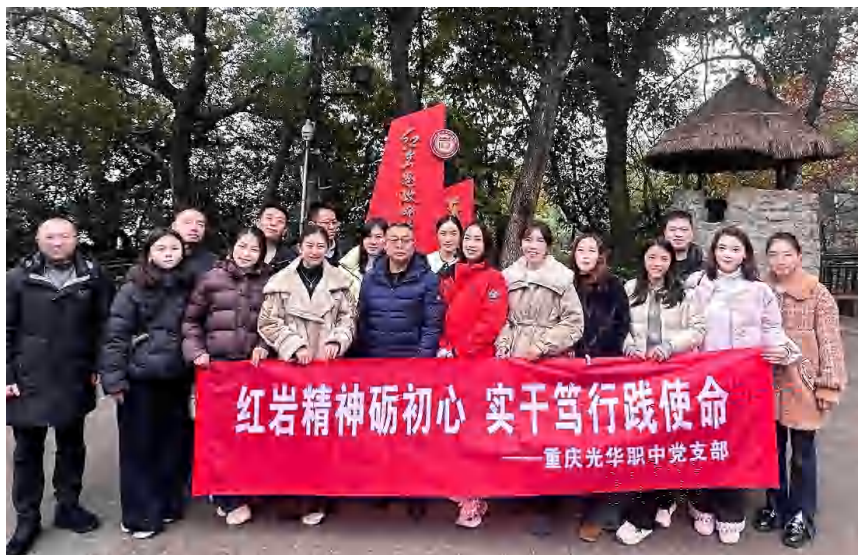
图 13 传承红色文化 红岩思政教育活动