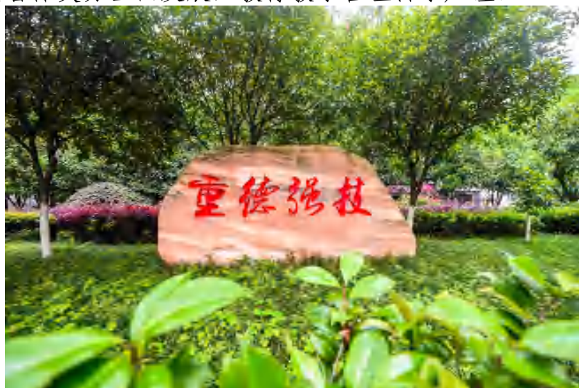
图 2 基本情况 重德强技 景观石

学校办学特色突出，学校实行全封闭、全方位、全天候的“三全”管理，注重自我教育、自我管理、自我服务的“三自”教育，加强国学和传统文化教育，学生每天诵读晨起自勉文，夜幕省思文，师生重大活动宣誓背诵光华教师誓词、光华学生誓词。学校强调学生人格品质、生存意志、自我激励、合作共事、健康心态的综合素质培养，注重学生德智体美劳全面发展，教育教学管理科学严谨。