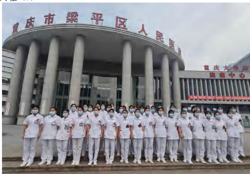
图 15 人才共育 护理专业临床实习动员大会

各科室实习结束时,对学生进行业务考核,采取技能操作、口试、笔试等方式进行,根据学生掌握的理论知识的深度、广度及其灵活运用操作的熟练程度与病例书写的规范化程度等方面进行成绩评定。所有实习结束后,由实习单位组织学生对实习阶段情况进行全面总结鉴定,填写实习鉴定表,出具实习证明,加盖实习单位公章后密封寄(或代送)学院护理系。通过临床实习,学生将理论学习与医院实践充分融合,全面提高自身综合素质,同时也为毕业后考取护士执业资格证书打下坚实基础。