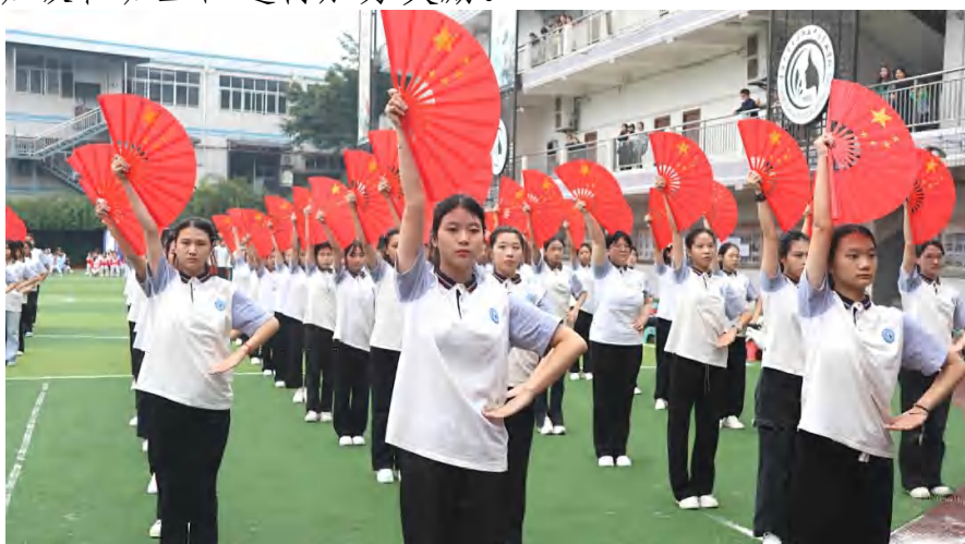
图 16 校园特色文化 国学校园文化引领下的学生风采展示

创建成功后各特色班级在学校统一指导下，制作展板、宣传画等进行班级建班特色展示。组织特色班级创建报告会，特色班级组织团队讲述创建细节、创建活动中的精彩故事。学校对特色班级进行表彰，并颁发特色班级班牌。期末依照相关考核细则，对创建特色文化班级成功的班级和班主任进行加分奖励。