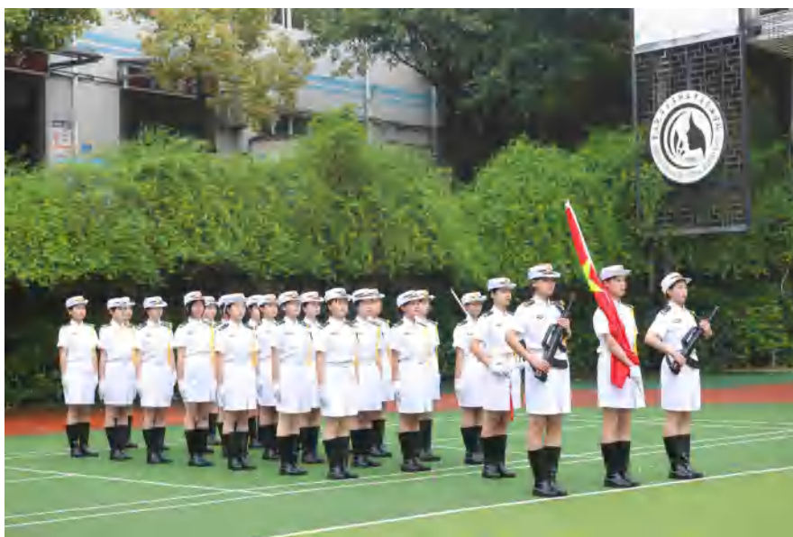
图 4 立德树人 国旗护卫队风采展示