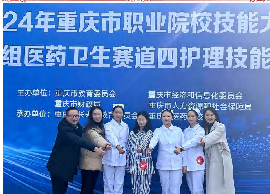
图 7 技能成长 师生参加市级技能大赛