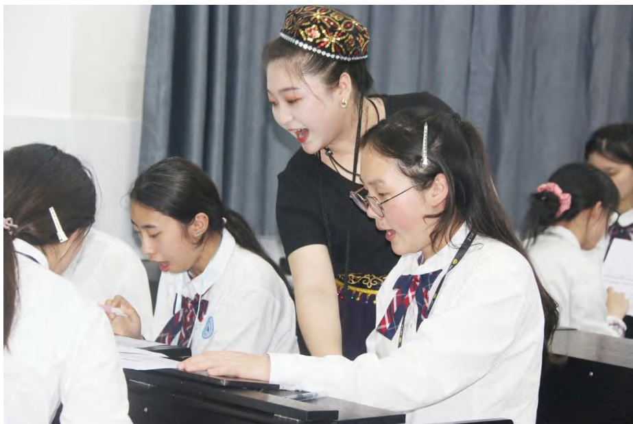
图 5 教师队伍 优秀教师示范课活动

学校高度重视“三教”改革，加强教法改革，规范教学设计与内容改革、教学组织与实施改革、教学方法与手段改革、教学管理与评价改革；规范教材建设，落实教材建设规划与管理、职业教育规划教材使用、规范教材选用；加强师资队伍建设，落实教师高层次人才引进、师德师风建设、“双师型”教师队伍建设、教师培养培训、教师团队建设、教师教学与教科研能力提升。