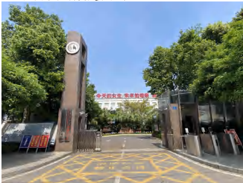
图 1 基本情况 学校校门

庆市重点中职学校”称号；第二步：2011—2020 年，走“内涵发展、特色强校”之路，塑造学校品牌，提升学校知名度和美誉度，确保学校可持续、健康发展；第三步：2021—2030 年，建立现代职业学校制度，拟请专家团队经营管理学校，奠定“百年光华”发展之基础。学校发展规划的落实情况良好，学校坚持党建引领高质量发展，学校章程科学规范，现代学校制度建设完善。