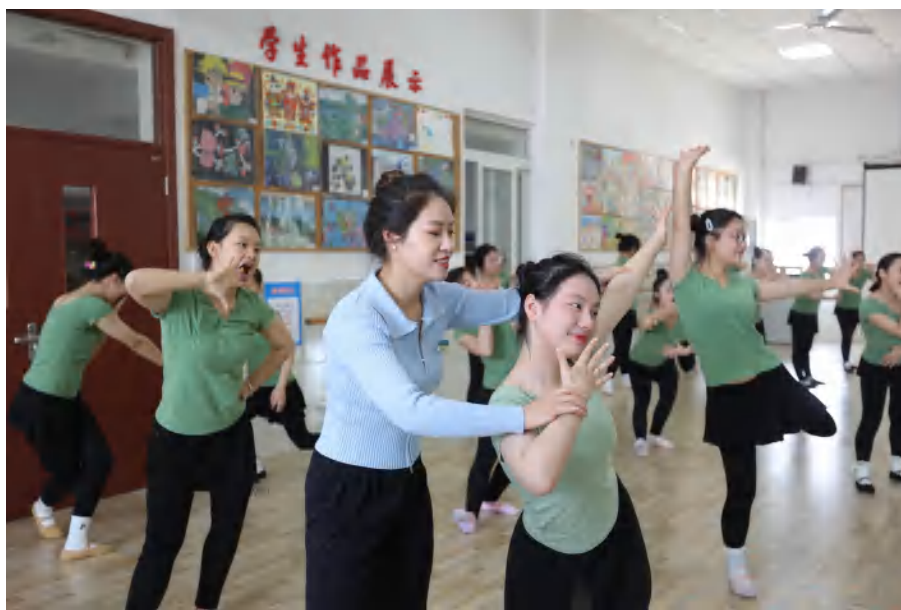
图 6 教师队伍 卓越课堂“五步四法”教学模式实践