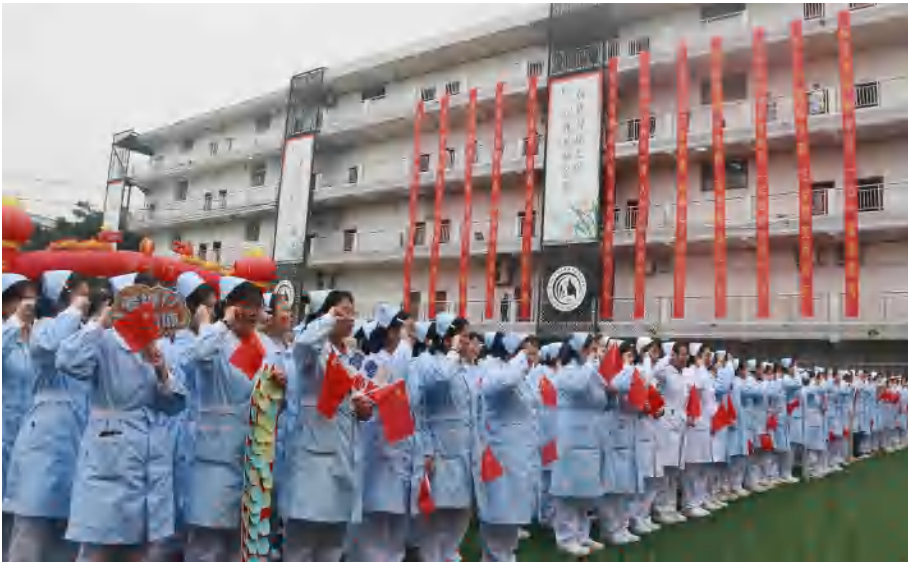
图9 学生发展 毕业生高考誓师大会