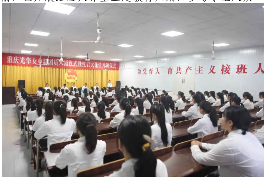
图 12 传承红色文化 红岩大课堂开讲仪式

学校“深挖红岩精神的丰富内涵与时代价值，把思政课建设得更强、更实、更活。”在沙坪坝区教委的领导下，学习总结开展红色教育的经验，积极建设“红岩大课堂”，探索出一条实践落地的新路。截止目前，已开展红岩大课堂主题教育六期，参与学生人数 680 人。