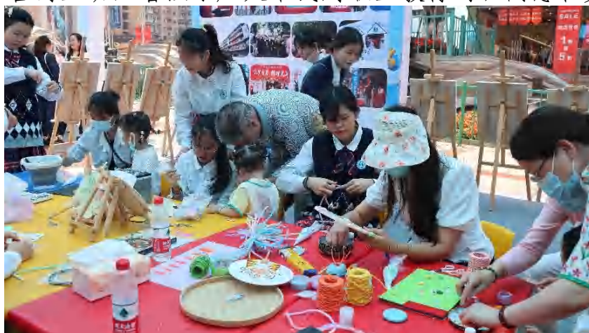
图 20 政策落实 职教月活动体验区

同时学校精心设计了职业体验活动展区，有“彩色童年”“创意扭戴”“艺术工坊”“童心绮丽”“袋上艺术”等项目，吸引了众多市民前来咨询互动，增强了广大市民对职业教育的认同感和支持度。