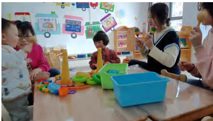
图 11 服务地方社区 幼教专业学生志愿者社区支教活动