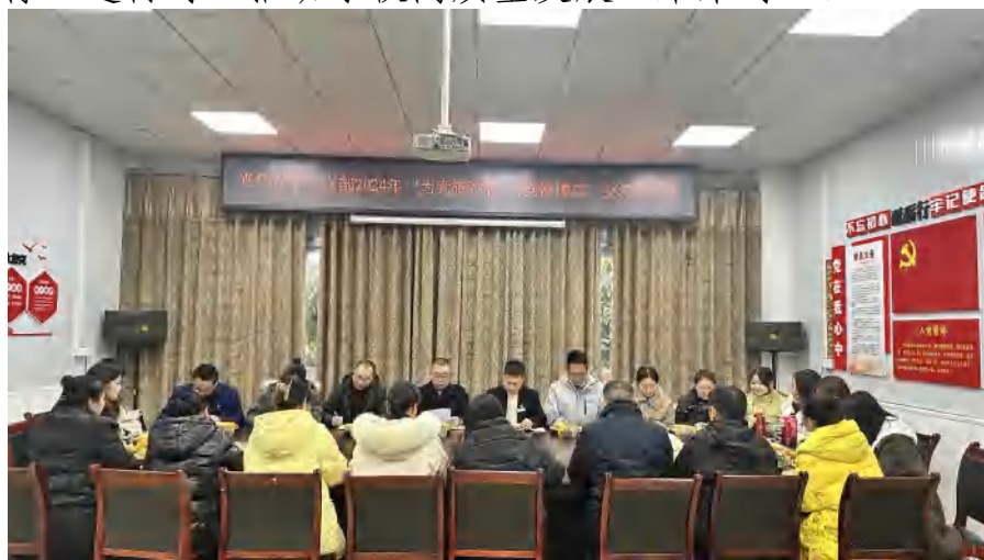
图 18 党建引领 党支部深入开展党员交流座谈会

下一步，学校将坚持以习近平新时代中国特色社会主义思想为指导，边学习、边对照、边检视、边整改，把主题教育同坚定理想信念结合起来、同职业教育发展结合起来，不断为职教发展注智赋能，以主题教育“进行时”推动学校高质量发展“未来时”。