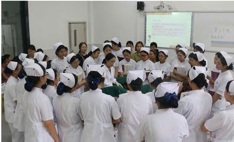
图 10 服务行业企业 职教一堂课活动