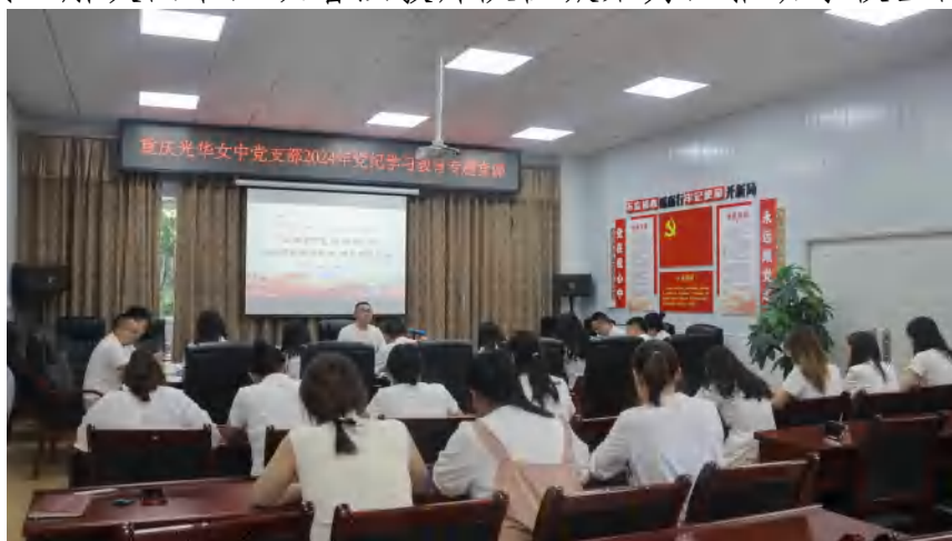
图 17 党建引领 党支部党员党纪学习教育

（4）深化党内关怀开展帮扶。制订了定人、定责、定向、定标的“四定”帮带责任制和党员政治生日谈心制度，开展党支部书记“帮带”党员、优秀党员教师“帮带”年轻教师活动，帮助他们增强党性、提高素质、解决困难，以增强教师队伍凝聚力，推动学校全面发展。