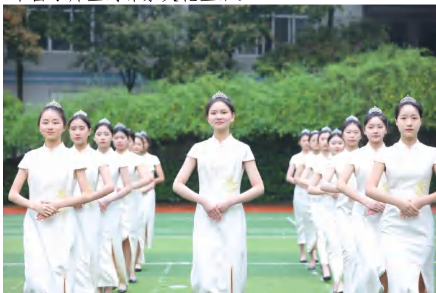
图 8 多样成才 学生礼仪社团日常训练活动

学校高度重视校园文化建设，长期统筹组织各类校内外文化活动，学校积极推行“德育主题活动月”工作。三月“学雷锋”；四月“爱国卫生运动与垃圾分类”；五月“青年大学习”；六月“诚信伴我行”；九月“劳动创造美好生活”；十月“爱国主义教育”；经过系列活动的开展，丰富了师生的课余文化生活。